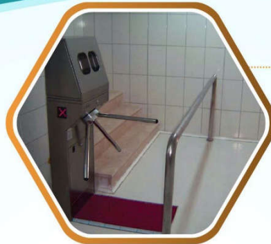
TAPPETO IGIENIZZANTE DISINFEZIONE SUOLA CALZATURE