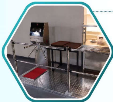
BARRIERA IN ACCIAIO INOX AISI 304