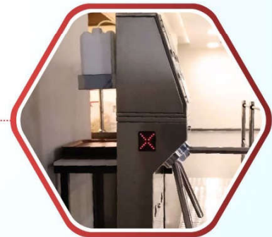
TANICA PER PRODOTTO IGIENIZZANTE